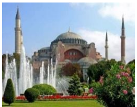
St Sophia Kerk